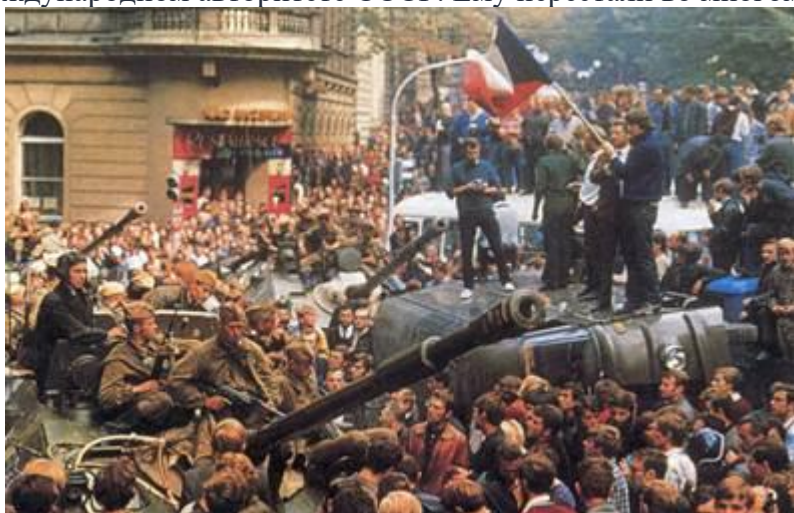
Рис. 7. Пражская весна 1968 г.

Первым значимым внешнеполитическим событием стала т.н. Пражская весна 1968 г. (Рис. 7), когда руководство Чешской коммунистической партии во главе с А. Дубчеком (Рис. 8) начало демократические реформы. Они проходили под лозунгом «Давайте построим социализм с человеческим лицом». Эти реформы заключались в том, что народу давалось больше свобод, меньше стало давление партии и т.д., но ничего радикального в стране не происходило. Но опасение СССР потерять Чехословакию как союзника и социалистическую страну присутствовало. В августе 1968 г. войска стран Организации Варшавского Договора были введены в Чехословакию. Со стороны Чехословакии эти действия были восприняты как агрессия против независимого государства. Эти события отрицательно сказались на международном авторитете СССР. Ему перестали во многом доверять союзники.