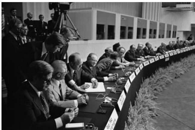
Рис. 5. Обсуждение Хельсинских соглашений

Основных причин международной разрядки было несколько. Во-первых, Советскому Союзу удалось догнать США по объёму ядерных вооружений, то есть установить т.н. паритет стратегических ядерных вооружений. Америка понимала, что, если она запустит свои ядерные ракеты в СССР, он может сделать то же самое, и тогда это грозило бы разрушением мира и всей человеческой цивилизации. Поэтому США пошли на урегулирование конфликта и разрядку отношений. Во-вторых, это взаимные экономические интересы и выгоды стран, которые были необходимы после кризиса начала 1970-х гг.