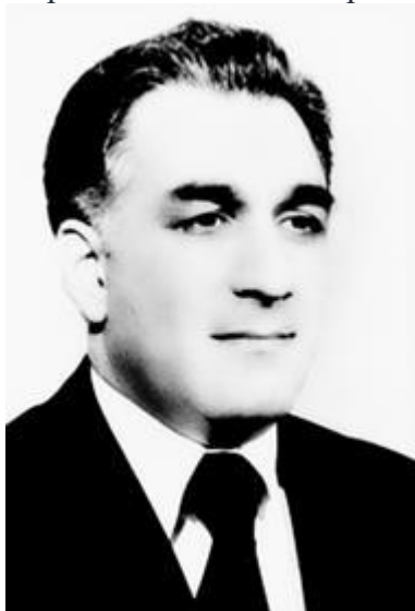
Рис. 11. Х. Амин – афганский диктатор

Большая часть авторитета СССР в странах третьего мира рухнула в декабре 1979 г., когда СССР ввёл войска в Афганистан. Причиной этого шага советского государства являлось то, что руководство страны опасалось, что на южных границах СССР в условиях холодной войны окажутся американцы. Дипломатически ввод советских войск в Афганистан не был оформлен. Х. Амин (Рис. 11), афганский диктатор, был свергнут и убит в первые же часы советского вторжения, и в столице утвердился у власти советский ставленник Кармаль. Установить контроль над большей частью территории страны не удалось ни ему, ни советским интервентам, но Афганистан всё же остался социалистическим государством. Таким образом, афганский кризис стал симптомом того, что внешняя политика СССР 1980-х гг. претерпевала тяжёлое и кризисное состояние.