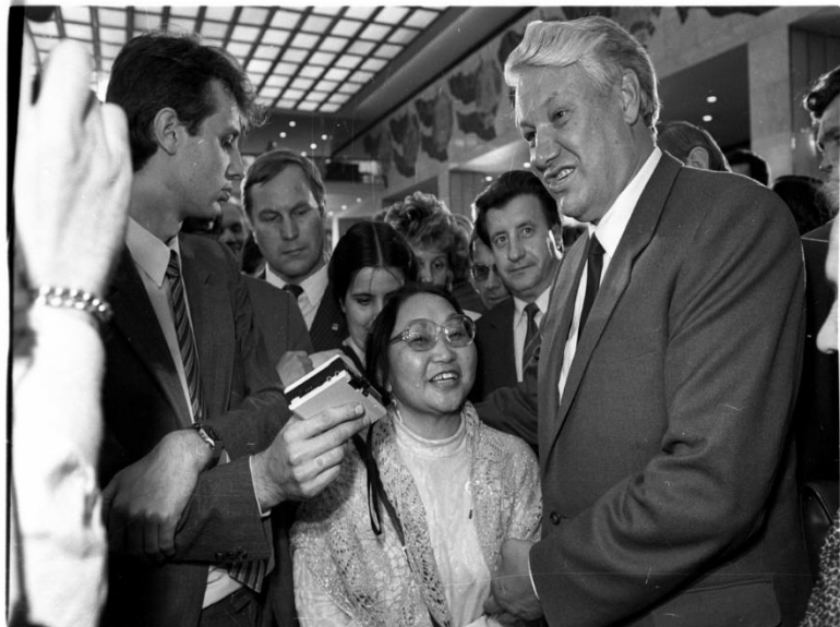
Рис. 4. Б.Н. Ельцин