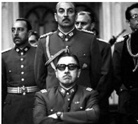
Рис. 11. А. Пиночет – диктатор Чили

Большая часть авторитета СССР в странах третьего мира рухнула в декабре 1979 г., когда СССР ввёл войска в Афганистан. Причиной этого шага советского государства являлось то, что руководство страны опасалось, что на южных границах СССР в условиях холодной войны окажутся американцы. Дипломатически ввод советских войск в Афганистан не был оформлен. Х. Амин (Рис. 11), афганский диктатор, был свергнут и убит в первые же часы советского вторжения, и в столице утвердился у власти советский ставленник Кармаль. Установить контроль над большей частью территории страны не удалось ни ему, ни советским интервентам, но Афганистан всё же остался социалистическим государством. Таким образом, афганский кризис стал симптомом того, что внешняя политика СССР 1980-х гг. претерпевала тяжёлое и кризисное состояние.