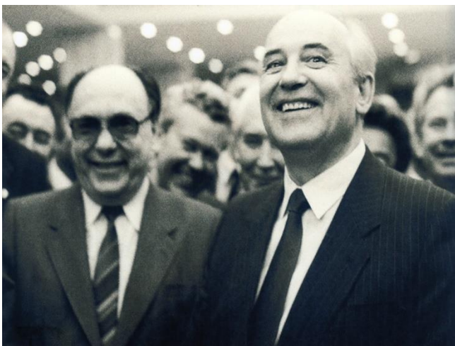
Рис. 7. Александр Николаевич Яковлев и Михаил Сергеевич Горбачев

Горбачёв был для своей должности сравнительно молодым человеком, мог говорить без бумажки, чувствовал себя раскованно среди толпы. Наконец, он сам пошёл в народ, что по тем временам стало настоящей сенсацией. Вместе с тем чувствовалось, что новому генсеку не просто даются первые месяцы работы. Это невольно прорывалось в его словах: «Кто не настроен перестраиваться, должен уйти, не мешать». Люди догадывались, что далеко не все наверху солидарны с Горбачёвым. Это вызывало к нему симпатии, делало его общественную поддержку исключительно широкой.