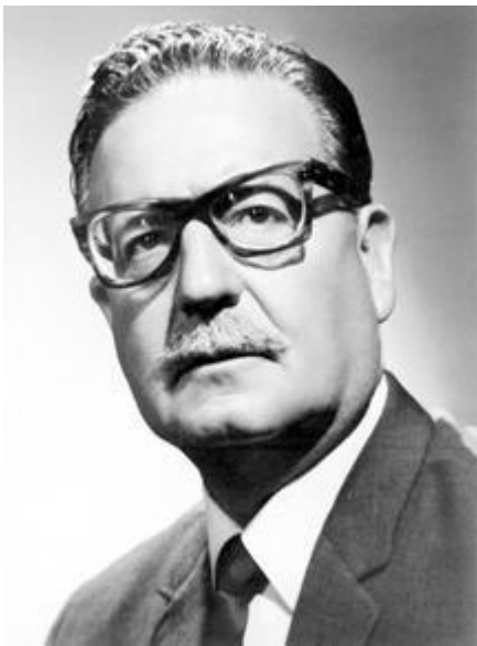
Рис. 10. С. Альенде – социалистический руководитель Чили (Источник)

Что касается стран, которые пытались следовать социалистическим путём, то это были Вьетнам, Ливия, Конго, Мадагаскар, Лаос, Кампучия. Также это были страны Латинской Америки: Никарагуа, Чили, где С. Альенде (Рис. 10) начал демократические реформы, но потом власть захватил диктатор А. Пиночет (Рис. 11) при прямой поддержке США, и страна ушла из социалистического лагеря в капиталистический.