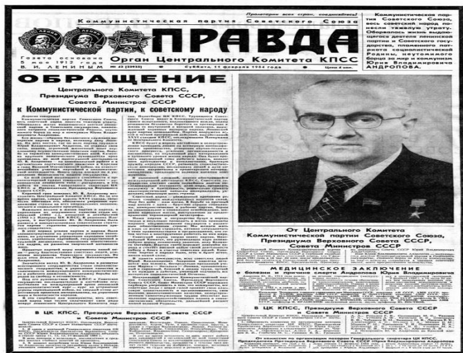
Рис. 1. Юрий Владимирович Андропов

До последнего дня Брежнев продолжал осуществлять представительские функции. 7 ноября 1982 г. он в последний раз появился на трибуне Мавзолея, приветствуя по традиции парад и демонстрацию трудящихся. Утром 10 ноября Брежнев умер.