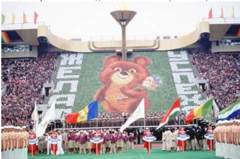
Рис. 6. Открытие Олимпиады 1980 г. в Москве

Считается, что поводом для нового витка международной напряжённости стало решение Советского Союза в 1979 г. ввести войска в Афганистан. Ответом на это стала массовая международная антисоветская кампания. Америка и её союзники бойкотировали Олимпиаду 1980 г. (Рис. 6), проходившую в СССР. В ответ советская олимпийская сборная бойкотировала летнюю Олимпиаду 1984 г., проходившую в Лос-Анджелесе. Также сюда можно отнести катастрофу с южнокорейским пассажирским самолётом над о. Сахалин. Кроме того, американцы стали наращивать вооружения и размещать ракеты средней дальности в Европе. СССР также начал перевооружение в социалистических странах и установил в них ракеты. Все эти действия привели к тому, что в середине 1980-х гг. в отношениях Советского Союза и западных стран наступил кризис. Данный кризис не решался в рамках прежней внешней политики СССР, поэтому требовалось срочное изменение внешнеполитического курса страны, так как мировые отношения капиталистического и социалистического блоков шли к полному охлаждению отношений.