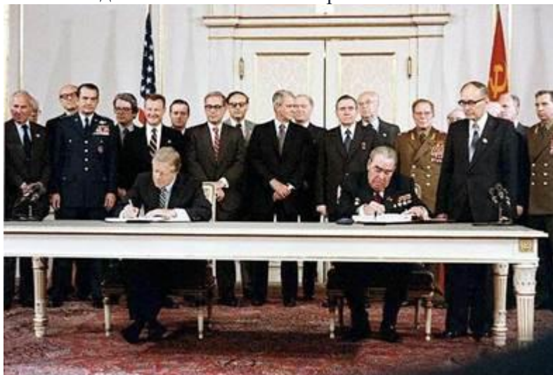
Рис. 4. Подписание ОСВ-2 Л.И. Брежневым и Дж. Картером

Главным документом времени разрядки стал Заключительный акт совещания о безопасности и сотрудничестве в Европе, подписанный в г. Хельсинки в 1975 г. всеми европейскими странами, СССР, США и Канадой (Хельсинские соглашения) (Рис. 5). В этом договоре впервые после окончания Второй мировой войны были заложены международные принципы, по которым жила и сейчас живёт Европа: нерушимость государственных границ, неприменение силы стран в отношении друг друга, решение конфликтов мирным дипломатическим путём, невмешательство государств во внутренние дела друг друга, суверенность государств, соблюдение и уважение прав своих граждан, а также граждан других государств, уважение и соблюдение прав человека. Значение Хельсинских соглашений было в том, что мировая общественность перестала беспокоиться и переживать по поводу возможной ядерной войны, и в мире установился порядок.