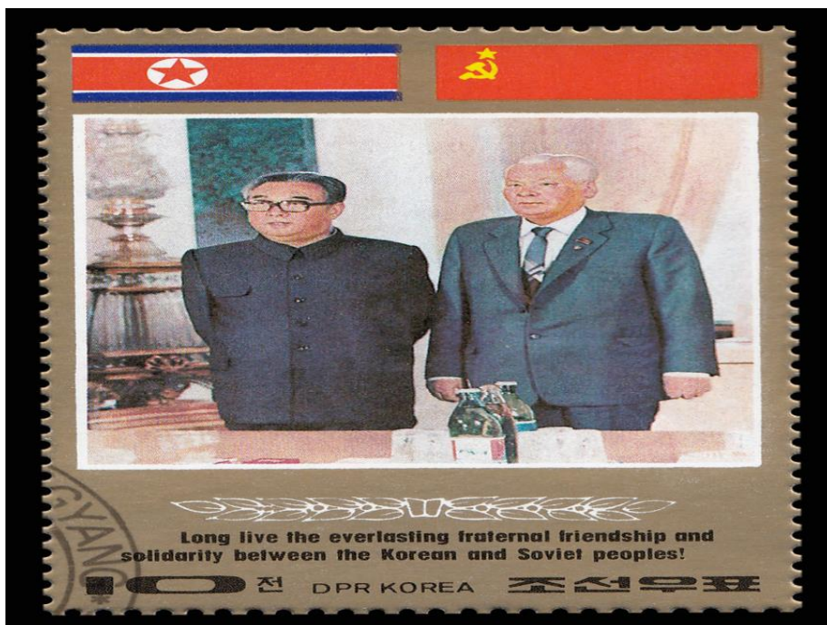
Рис. 2. Встреча Ким Ир Сена с К.У.