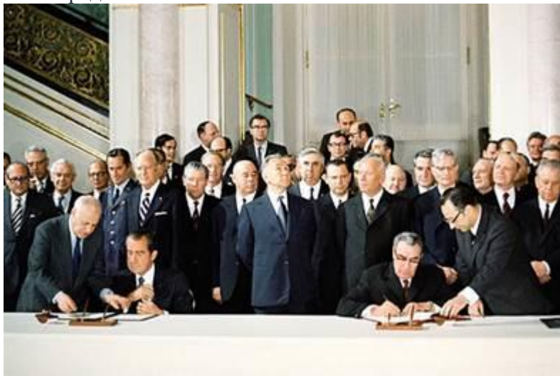
Рис. 3. Подписание ОСВ-1 Л.И. Брежневым и Р. Никсоном

Эпоху разрядки символизирует ряд международных договоров. Это договоры по ограничению стратегических вооружений между СССР и США – ОСВ-1 (Рис. 3) (1972 г.) и ОСВ-2 (Рис. 4) (1979 г.). Также это договор СССР и США 1973 г. о необходимости предотвращения ядерной войны. Было осуществлено несколько встреч между Л.И. Брежневым и главами американского государства (Л. Джонсон, Р. Никсон, Дж. Форд, Дж. Картер), причём эти встречи проходили как в Советском Союзе, так и за его пределами.